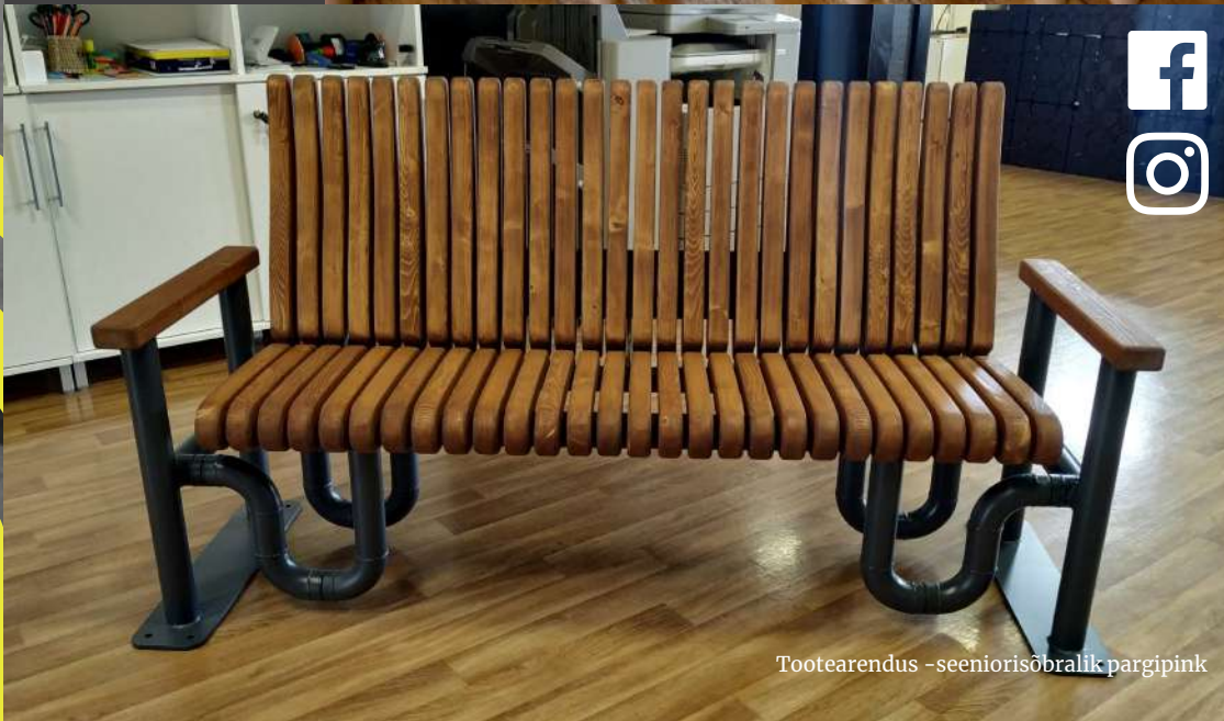
Tootearendus -seeniorisõbralik pargipink