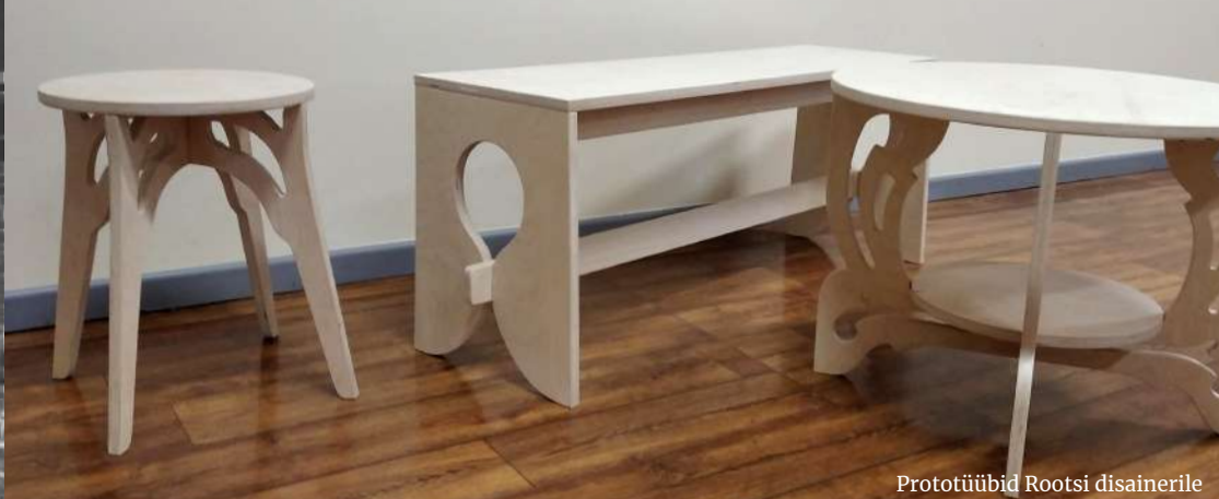
Prototüübid Rootsi disainerile

Võrumaa Kutsehariduskeskuse Puidutöötlemise ja mööblitootmise kompetentsikeskus TSENTER