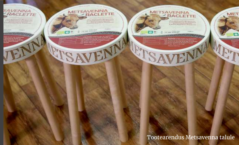
Tootearendus Metsavenna talule