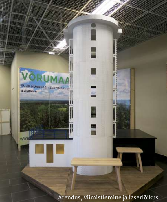
Arendus, viimistlemine ja laserlõikus