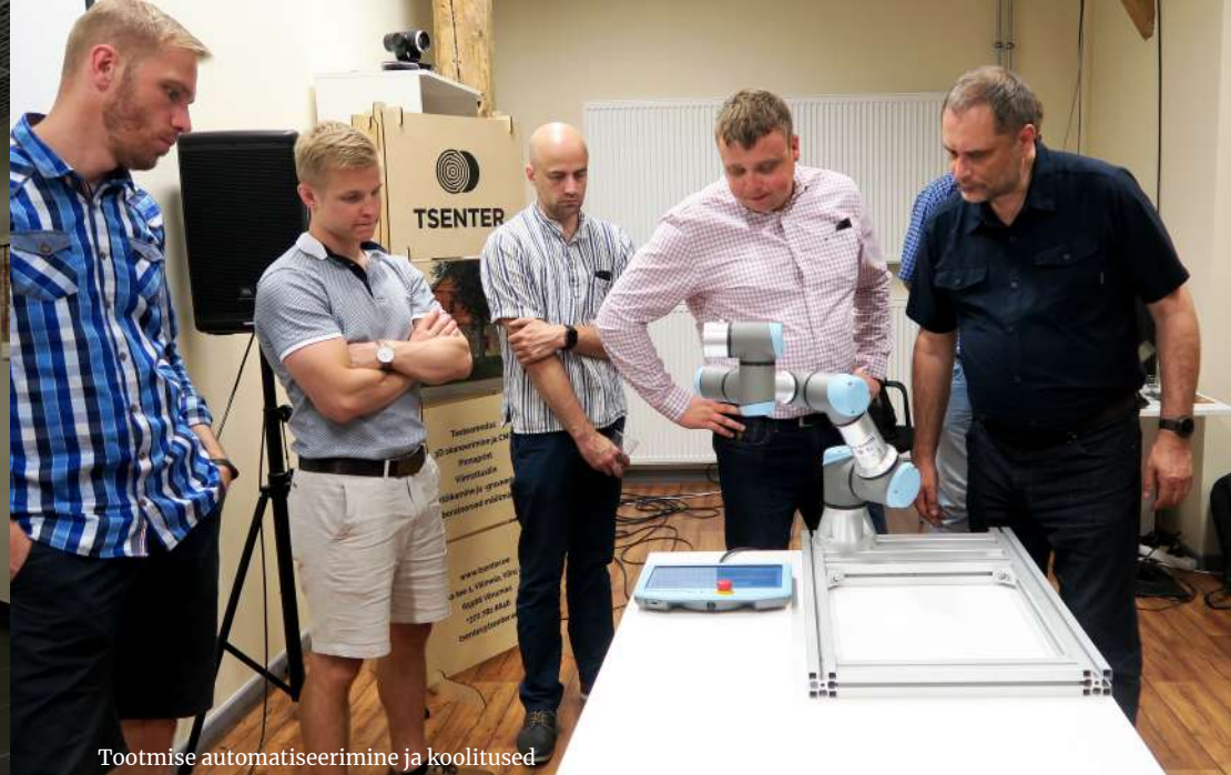
Tootmise automatiseerimine ja koolitused